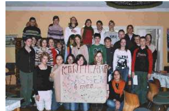
SASSEN 4EVER !