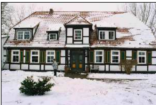
Auch im Winter ist es in Sassen schön ...