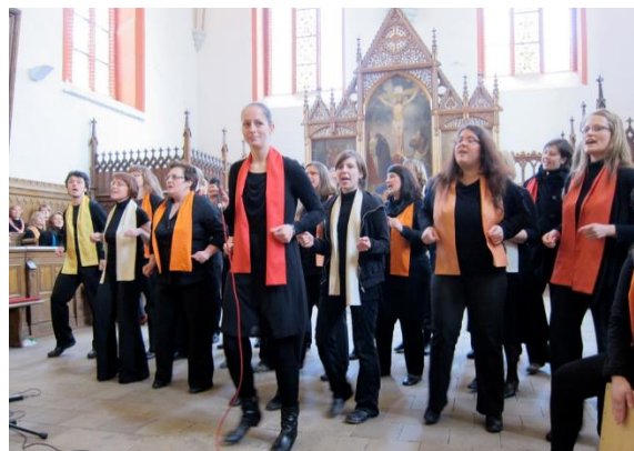
Gospelchor der Jugendkirche Rostock

5% - INITIATIVE im Evangelisch-Lutherischen Kirchenkreis Mecklenburg