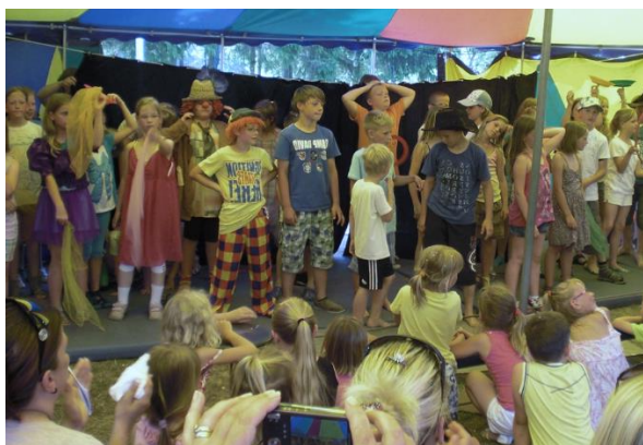
Abschlussfest eines Schulprojekts in Zehna

Machen Sie mit und werden Sie Förderer weiterer kirchlicher Projekte in Mecklenburg!