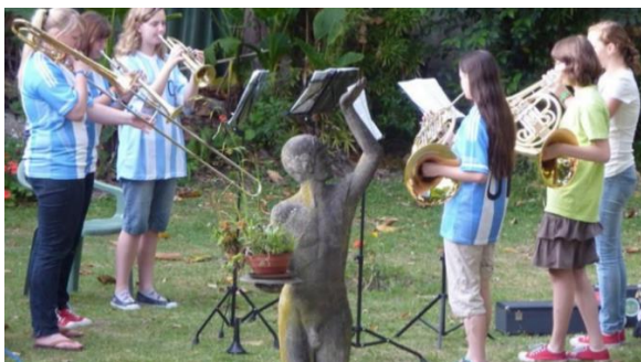
junge Bläser*innen aus Mecklenburg in Argentinien

Bisher wurden über 500.000 € für die Unterstützung verschiedener Projekte bereitgestellt.