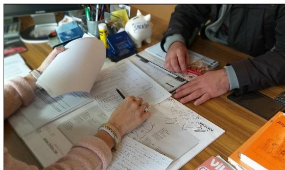
soziale Beratung für Kirchenasyl in Schwerin

Sie sind eingeladen, konkrete Projekte zu unterstützen, die dringend notwendig, aber strukturell nicht finanzierbar sind. Sie helfen mit Ihrer Spende, ein kleines Stück am Reich Gottes mit zu bauen!