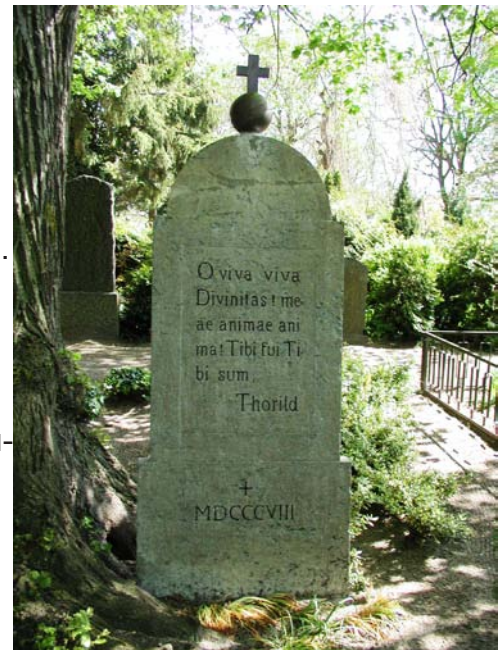
Grabstein des schwedischen Dichters Thomas Thorild in Neuenkirchen.

Es steht zu befürchten, da nicht mehr für alle Friedhöfe kostendeckende Kalkulationen gemacht werden können, einige geschlossen werden müssen. Allerdings müssen sie von diesem Datum an noch 25 Jahre weitergepflegt werden.