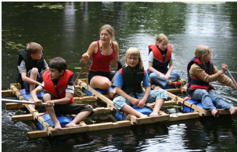
TEO on tour.

TEO ist ein kooperatives Bildungskonzept in Mecklenburg-Vorpommern zwischen den Kirchen, dem Ministerium für Bildung, Wissenschaft und Kultur und den Schulen des Landes. TEO hat sich zum Ziel gesetzt, durch gemeinsames Handeln zwischen verschiedenen Bildungspartnern an einer Kultur des beziehungsreichen Aufwachsens für Kinder und Jugendliche mit zu wirken. Das Konzept bietet Chancen, die Alltagssituationen von Kindern und Jugendlichen zu reflektieren und orientierende Lebenshilfe zu entwickeln.