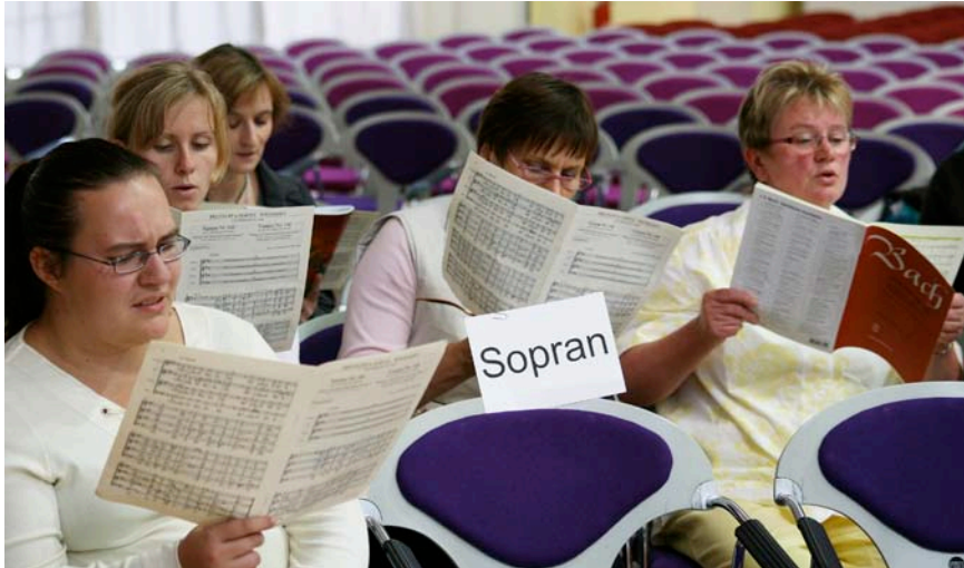
Workshop beim Chorfest in Neubrandenburg.

Eine herausragende Bedeutung kommt der Kirchenmusik in unserm Bundesland zu. Dies gilt für die Jugendarbeit, die Breitenarbeit, aber auch für Konzertveranstaltungen von regionaler und überregionaler Bedeutung.