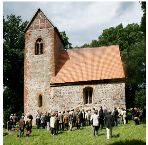
Tag der Fördervereine Mecklenburgs in Grüssow/Mecklenburg.

Eine besondere Tradition gibt es in Mecklenburg mit dem Tag der Fördervereine und Sponsoren, der jährlich veranstaltet wird. 2009 stand er unter dem Thema „Historische Taufen“. In diesem Jahr nahmen über 160 Personen an diesem Tag teil, der in Neustrelitz seinen Schwerpunkt hatte.