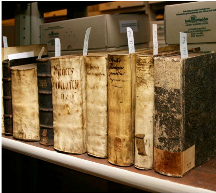
Im Schweriner Archiv.

Die beiden evangelischen Kirchen unterhalten Landeskirchliche Archive. Auch die Gemeinden und Pfarrstellen verfügen teilweise über eigene Archive. Die Pfarrarchive sind für den ländlichen Raum oftmals die ältesten Ortsarchive, da ein Großteil der Gutsarchive verloren gegangen ist. Die Unterlagen gehen in der Regel bis zum Dreißigjährigen Krieg zurück, in Einzelfällen auch darüber hinaus (Kirchenbücher aus der 2. Hälfte des 16. Jahrhunderts). Das Archiv der mecklenburgischen Landeskirche, bei dem die Arbeitsgemeinschaft für Mecklenburgische Kirchengeschichte angesiedelt ist, gibt das „Mecklenburgia Sacra“ betitelte Jahrbuch für Mecklenburgische Kirchengeschichte heraus und leistet damit einen wichtigen Beitrag zur Geschichtskultur des Landes.