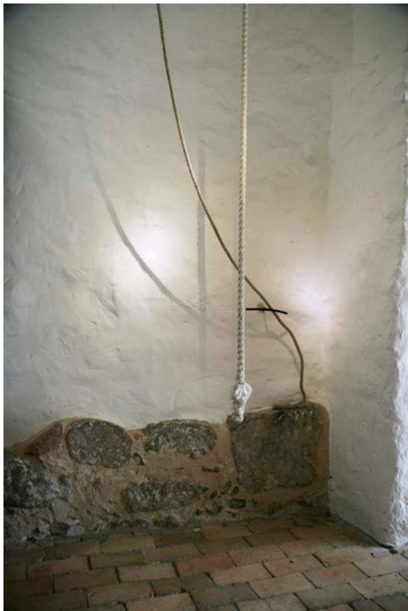
Glockenseil in Benz auf Usedom.

Die beiden evangelischen Kirchen mit ihren zusammen rund 290.000 Mitgliedern in 490 Kirchgemeinden mit ihren ungefähr 18.000 ehrenamtlich Tätigen leisten einen eindrucksvollen Beitrag zu der vielfältigen Kulturlandschaft in Mecklenburg-Vorpommern. Herausragend ist die Arbeit der Kirchen vor allem in der Musik und in der Denkmalpflege. Dazu kommen die 55.000 Mitglieder der katholischen Gemeinden