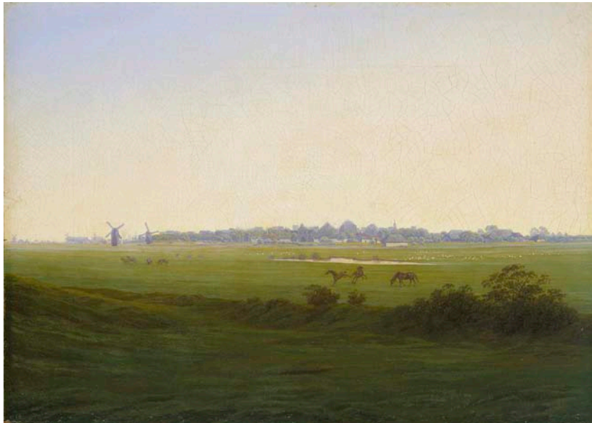
Caspar David Friedrich Wiesen bei Greifswald Hamburger Kunsthalle (Bearbeitung)