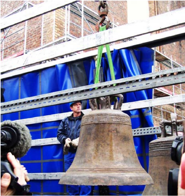
Neue Glocken für St. Marien in Rostock.

sicherheitsrisiko geworden sind. Spenden für Glocken bilden die Grundlage für viele Erweiterungen eines Geläutes.