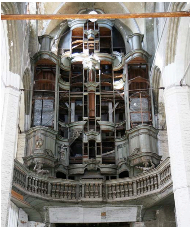
Leerer Orgelprospekt in St. Jakobi in Stralsund.

Beide Landeskirchen verfügen über 910 zumeist wertvolle historische Orgeln. In Zusammenarbeit mit dem Kirchenmusikerverband wurden verschiedene Orgelkurse für ehren- und nebenamtliche Organisten veranstaltet. Der Bedarf für Fortbildung der Ehrenamtlichen wird nach wie vor hoch eingeschätzt.