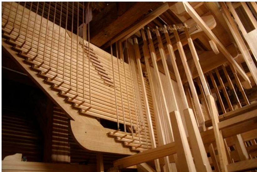
Orgel St. Nikolai in Stralsund.

Die Restaurierungsprojekte der drei großen historischen Orgeln in St. Nikolai, St. Marien und St. Jakobi in Stralsund werden auf engstem Raum ein Ensemble hochbedeutender Instrumente wiedererstehen lassen, das im gesamten Ostseeraum einzigartig ist, und ergänzt wird durch eine Fülle weiterer historischer Orgeln des 17. bis 20. Jahrhunderts in Mecklenburg-Vorpommern. Deshalb liegt es nahe, in der Weltkulturerbestadt ein Orgelzentrum entstehen zu lassen.