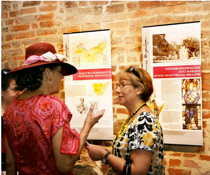
In der Bugenhagen-Ausstellung in Stettin.

Beide Landeskirchen fördern jedes Jahr mit Druckkostenzuschüssen Publikationen, die sich mit unserer Region oder der Backsteingotik befassen. Dies wird auch die künftige Nordkirche fortsetzen.