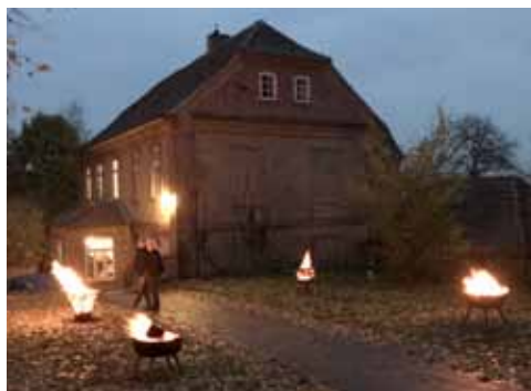
St.-Martins-Gottesdienst (I.) und Feuerschalen auf dem Weg von der Hubertusmesse zum Wildschweingulasch im Pfarrhaus.