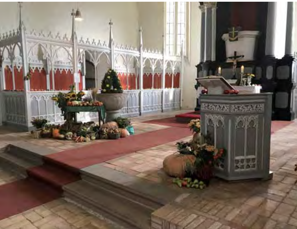
Die zum Erntedank festlich geschmückte St.-Thomas-Kirche in Damshagen.