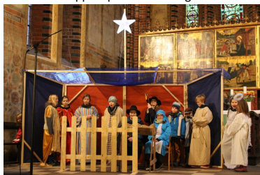
Krippenspiel in St. Marien