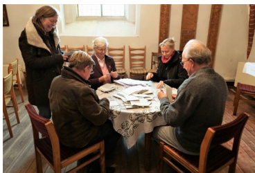
Auszählung der Stimmen zum KGR in St. Georgen