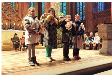
Krippenspiel in St. Georgen