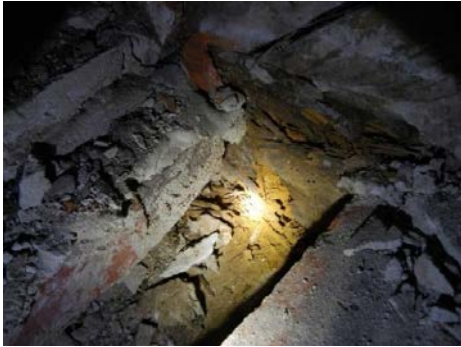
Schädigung des Balkenkopfes durch Braunfäule.