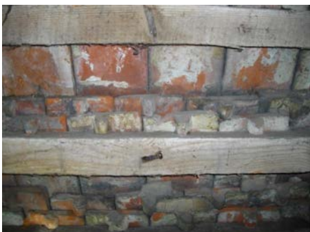
Die Dachlattung ist aus dem Jahre 1840. Sie ist vorgeschädigt.