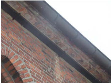
Stahlträger zur Absteifung des Gesimsmauerwerks