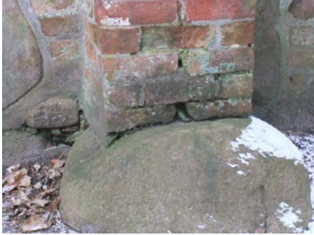
Schäden in der Verfugung.