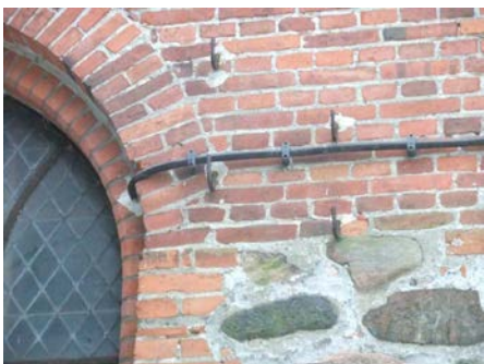
Hausanschluss zur Unterverteilung.