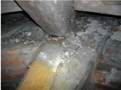
Die Balken sind auch außerhalb des Auflagers beschädigt.