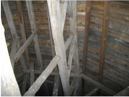
Der Fachwerkträger ist in Richtung Osten verformt