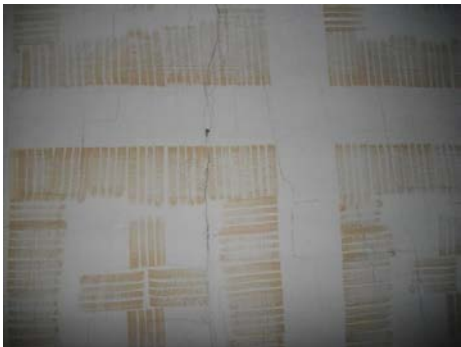
Längsrisse unterhalb der Decke