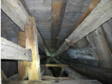
Blick in die Turmspitze:

Der Bereich ist für Untersuchungszwecke nicht zugänglich. Es sind teils Verstärkungen und Beifügungen an Aussteifungshölzern vorhanden. Der Kaiserstiel ist oberhalb der der Doppelzangen zweimal gefügt und neigt sich nach Westen.