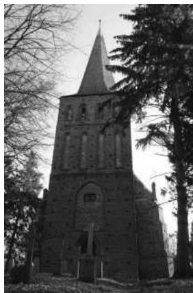
Die Kirche von Vilmnitz