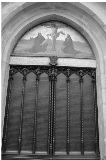
Thesentür der Schlosskirche zu Wittenberg